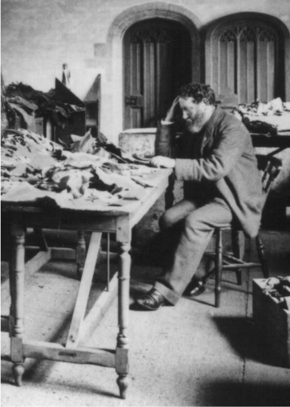
Solomon Schechter'in Kahire Genizası'ndaki çalışmasına ait bir görüntü

EK-6 Rudolf Leszynsky'nin "Der Neue Bund" isimli yazısında bahsettiği Solomon Schechter'in Kahire Genizası'nda yaptığı çalışmaya ait bir görsel