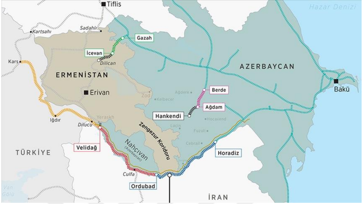
Harita: 2.2 Zengezur Koridoru

Kaynak: (Anadolu Ajansı) (Güncelleme: 21.12.2022)