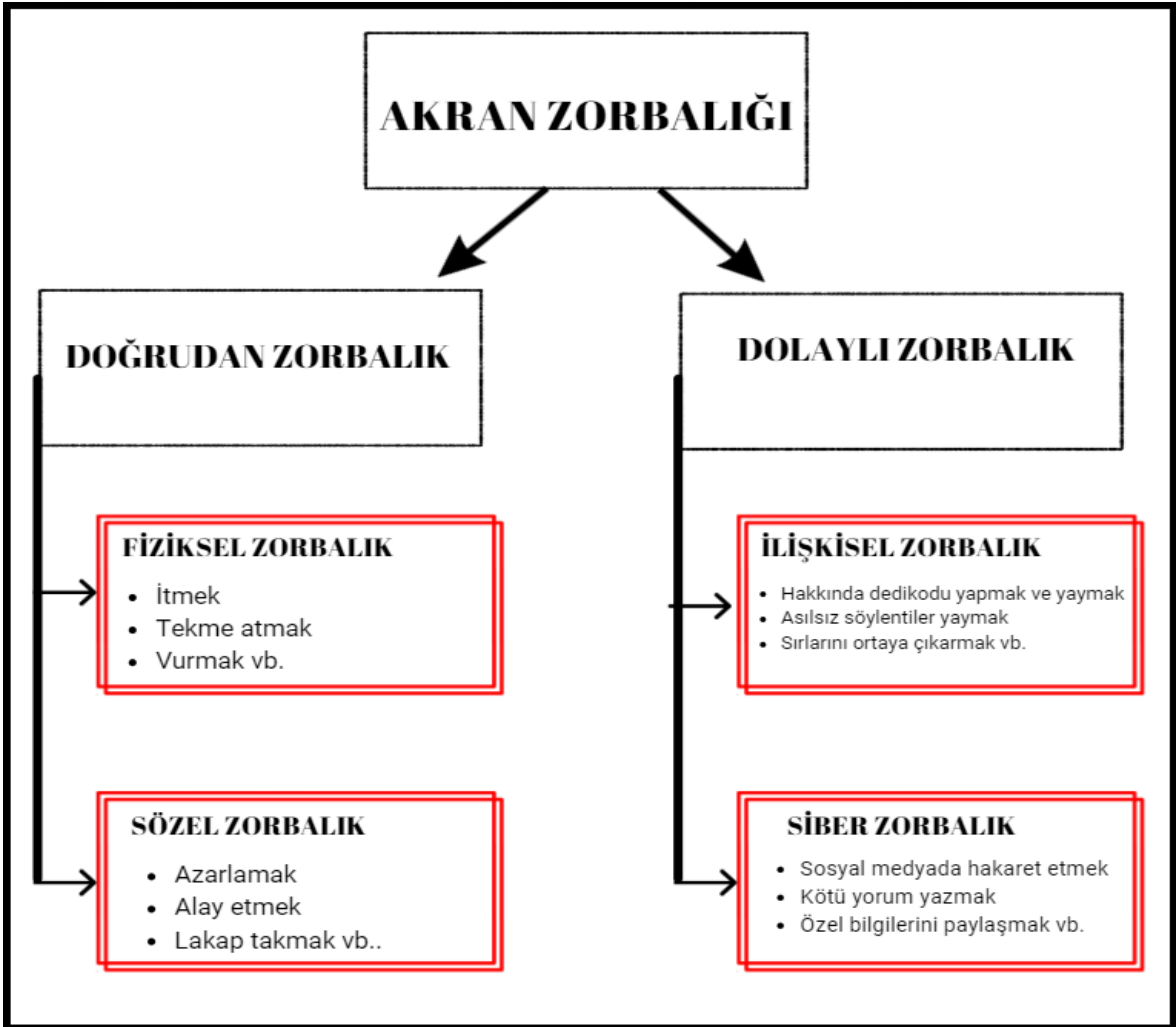
Şekil: 1.2. Akran zorbalığı türleri

Dolaylı zorbalıkta amaç kişinin sosyal ilişkilerine zarar vermektir. Kurbanı dolaylı olarak bir saldırı içerir ve üçüncü şahıslar üzerinden yapılabilir. Zorbalığı yapan kişi kimliğini gizleyebilir.