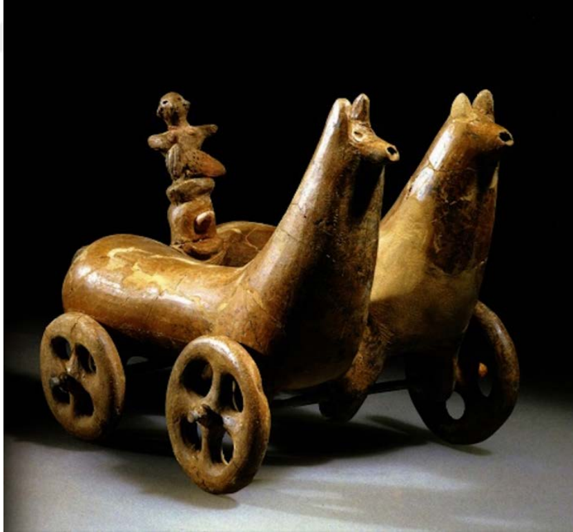
Şekil 1.5. Pers İmparatorluğuna ait at arabası oyuncacı

Pers İmparatorluğu'na ait olan at arabası oyuncacı dönemin medeniyet özelliklerini yansıtmaktadır. Pers İmparatorluğu geniş coğrafyaları kapsamış ve farklı kültürlerin içerisinde yer edindiği büyük bir medeniyetti. Her büyük imparatorlukta olduğu gibi bu ihtişamlı imparatorluk için de zanaat günlük yaşamın önemli bir parçasıydı. Persler, dönemleri boyunca çeşitli oyuncaklar üretmişlerdi. Özellikle de çocuklar için yapılan at arabası tarzında oyuncaklar, dönemin kültürel yapısını gösteren önemli örneklerdendir. At arabası için yapılan oyuncaklar çoğunlukla dönemin teknolojisine göre ahşap veya kilden üretilirdi. Bu tip oyuncaklar çocukları için eğlenceli vakit geçirebilecekleri bir araç olduğu gibi dönemin gerek ulaşım araçlarını gerek çeşitli savaş stratejilerini içermektedir. Detaylı işçiliklere sahip olan bu tarz oyuncaklar Pers ustalarının işçiliklerindeki ustalığa da önemli bir örnek olmaktadır. Arkeolojik çalışmalarda keşfedilen bu tip oyuncaklar, arkeologlar, tarihçiler için değerli bilgiler sunduğu kadar insanların kültürel özelliklerini araştıran antropologlar içinde bilgiler sunmaktadır. At arabası oyuncacı bulunduğu dönemin toplumsal yapısını, olağan yaşam şartlarını ve teknik gelişim düzeylerini anlamak adına bir köprü görevi görür. Bir diğer yandan, bu tip oyuncaklar Pers topluluğunun çocuklarına, aile yaşantılarına ne kadar değer verdiğini de göstermektedir (Çelik ve Çetintaş, 2022).