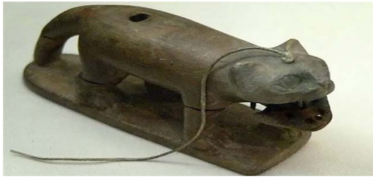
Şekil 1.1. Antik Mısır'dan bir kedi oyuncacı

Antik Mısır'a ait kedi oyuncacı ağız kısmı ipe çekilerek açılıp kapanacak biçimde tasarlanmıştır. Ağız kısmının oynar açıda yapılması nesnenin dini bir amaçla yapılmayıp çocuklar için oyuncak olarak tasarlandığını bize göstermektedir. Oyuncak yapımı için tema olarak kedi figürünün seçilmesi de ayrı bir önem taşımaktadır. Kediler Antik Mısır kültürü için metafizik anlamlar taşıyan bir çeşit dini figürdür. Mısır'da kedilerin ölen insanların ölümden sonraki hayatlarına geçerken yanlarında eşlik ederek geçiş aşamasını kolaylaştırdığına inanılırdı. Bu durum bize göstermektedir ki Mısırda o dönemin insanları dini inançlarını oyuncaklar yoluyla çocuklarına benimsetmek istemişlerdir (Hasdemir, 2019).