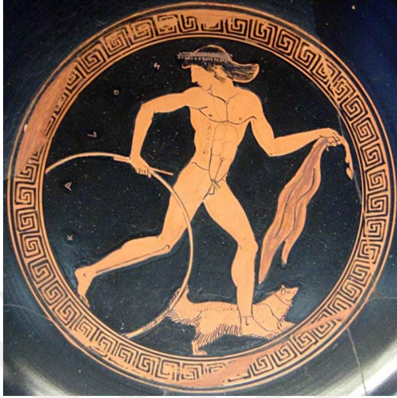
Şekil 1.15. Antik Yunan döneminden Çember ile oynayan bir genç tasviri