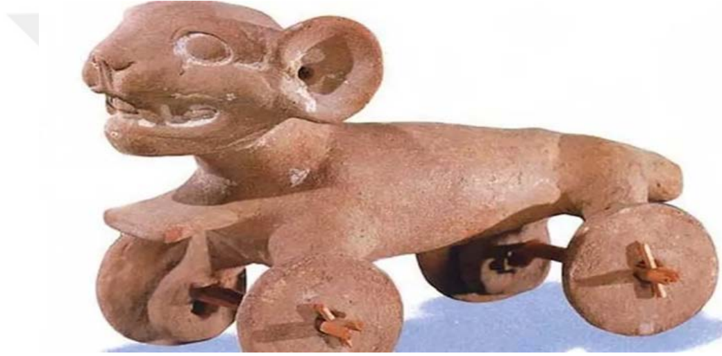
Şekil 1.2. Meksika Olmek Uygarlığına ait bir kaplan oyuncacı

Bu tekerlekli köpek figüründeki oyuncak örneđi Meksika'daki Aztek ve Maya uygarlıklarından da önce var olan Olmek uygarlığına aittir. Olmek uygarlığı erken dönem Mezoamerika uygarlığıdır. Meksika ve Orta Amerika'da bulunmaktadır. Bulunan bu figürün tekerlekleri olması tam olarak bir oyuncak örneđi olduğunu işaret etmektedir. Mısır medeniyetinde kediler hakkında sahip olunan inanış Olmek uygarlığında köpeđe atfedilmiştir. Ölen kişileri ruhani yolculuğunda diđer tarafa geçerken eşlik etmektedir. Bulunan bu oyuncak yine oyuncacın kültürel ve dini inanışları aktarmadaki rolüne deđerli bir örnek oluşturmaktadır. Dini motifler içeren oyuncakları erken yaşlarda gören çocuklar buldukları topluluğun deđerlerine aidiyet bağlanmaktadır (Sorenson, 1981).