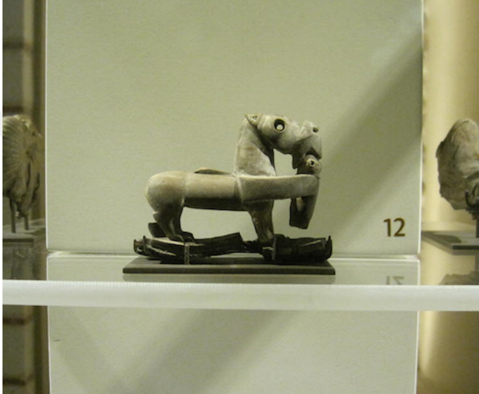
Şekil 1.7. Friglere ait ahşap hayvan figürlü oyuncak

Bulunan bu oyuncak durumu açıklayan önemli örneklerden biri olmuştur. Oyuncağın işçiliği ve malzeme kalitesine bakıldığında halk arasında sıkça kullanılabilecek bir oyuncak olmadığı görülmektedir. Ancak kalitesi daha iyi olsa da simge açısından ayrı bir zenginlik göstermemektedir. Hangi statüden olursa olsun belli temalar ve semboller aynı kalmaktadır. Bu açıdan bakıldığında da at figürü oyuncak için önemli bir örnek teşkil etmektedir (Güven, 2024).