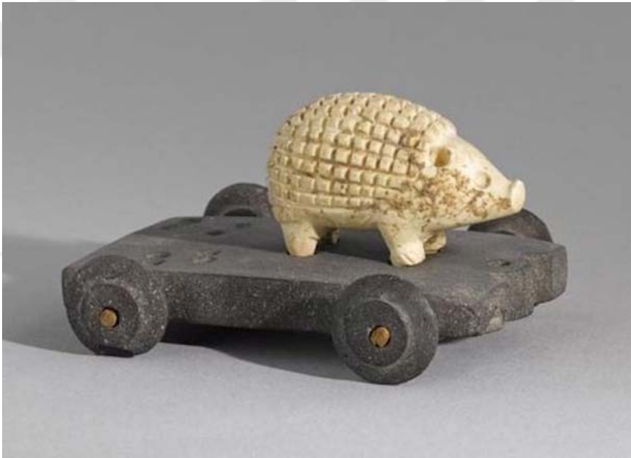
Şekil 1.8. Elam İmparatorluğunun başkenti Susa da İnshushinak tapınağında bulunan kirpi oyuncacı

geçmesi, bu tip nesnelerin gündelik yaşamın dışında dini inanışların alanında da değerli olduğunu ortaya koyar. Tapınaklar, antik topluluklar için ekonomik, kültürel ve dini etkileşimlerin en önemli konumu olmuştur, oyuncaklar da bu açıdan genç kuşaklara dini normları ve kültürel âdetleri öğretmek için yapılmıştır. Bu açıdan, kirpi oyuncacı, bir oyun ürünü olmasının yanında bir de toplumsal kimlik ve normlar için taşıyıcı rol üstlenmektedir. Önemli bir başka nokta da, bu tarz oyuncakların elimize ulaşması, Elam İmparatorluğu'nun çocuğa bakışı ve sosyal, kültürel hayatı ile ilgili önemli analiz yapma olanağı sağlamaktadır. Oyuncakların yapımında yararlanılan malzemeler ve üretim şekilleri, dönemin toplumlarının gelişmişlik düzeyi ve ticareti ile ilgili bilgiler göstermektedir. Kirpi oyuncacı gibi eserler, Elam kültürünün çocuklarının yaşantısına ve bu yaşantıdaki inanç sistemlerine bir kapı aralayarak, antik dönemlerin sosyal, kültürel yapısını anlamamıza olanak verir (Farrokh, 2019).