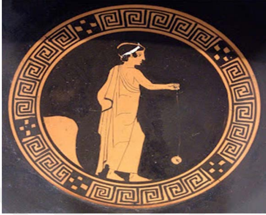
Şekil 1.13. Yunan vazosunda yoyo oynayan çocuk işlemesi