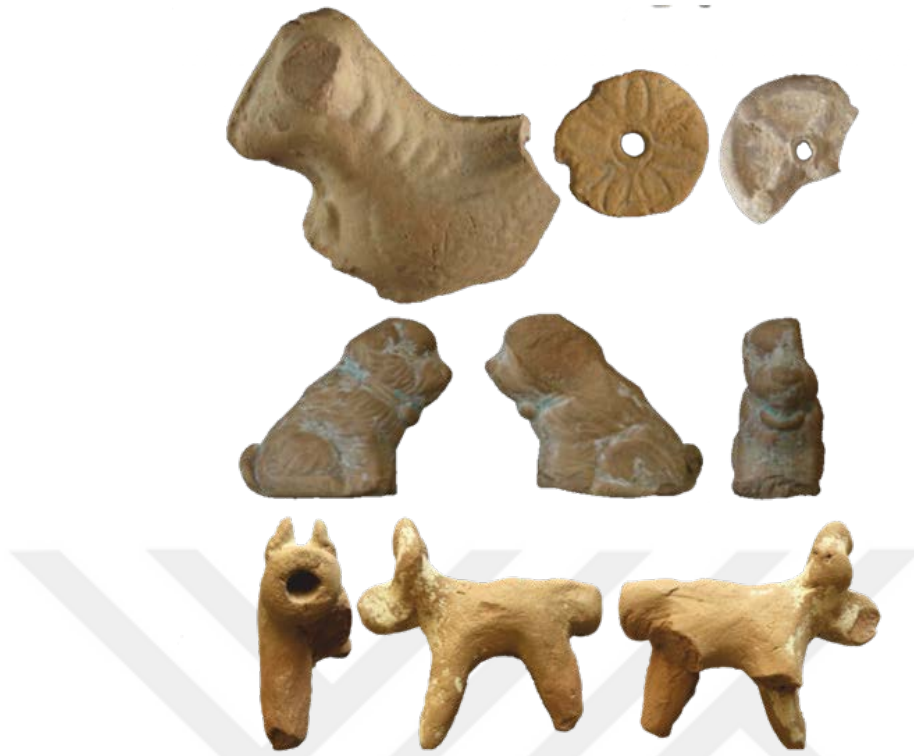
Şekil 1.12. Türkiye'nin İzmir şehrinde Smyrna kazılarında bulunmuş köpek ve koç tasvirli oyuncaklar