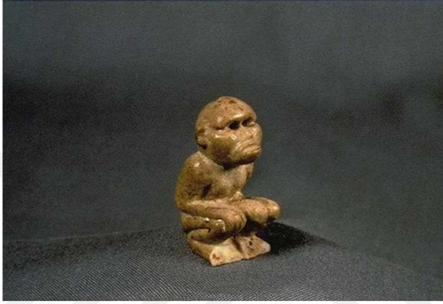
Şekil 1.9. İndus Vadisinde bulunan maymun tasvirli oyuncak

olabilir. Ancak hangi amaçla yapılmış olursa olsun gündelik hayat ve toplumsal değerler hakkında bilgi sağlayan nesnelere. Bu tip bir oyuncak bizlere tek başına bulunduğu kültürün doğası, iklimi ve yaşayış biçimi hakkında bilgi verir. Her habitat içinde gözükmeyen maymunlar sembolize edildiği kültürün değerlerini yansıtmaları açısından ayrıca bir niteliğe sahiptir. Bu noktada oyuncak olmasının ötesinde önemli bir kültür öğesine dönüşmüştür (Mark, 2020).