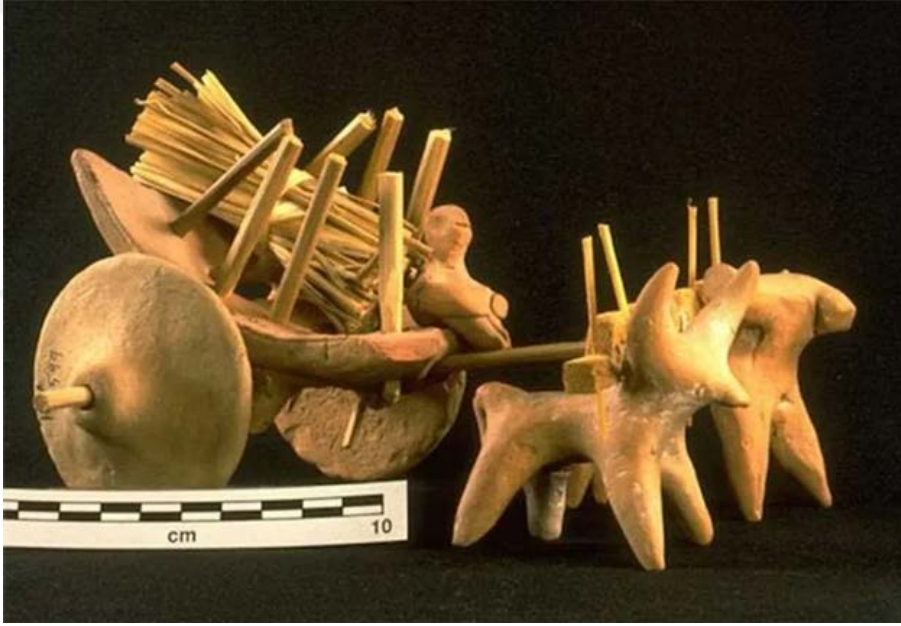
Şekil 1.6. İndus Vadisi Uygarlığına ait Harappa Şehrinde bulunan kağnı oyuncağı

İndus uygarlığına ait Harappa şehrinde bulunan bu oyuncak öküzler tarafından çekilen bir çeşit kağnı modelidir. Bu oyuncak antik dönemin sosyal ve kültürel yaşayışı hakkında bilgiler vermektedir. Oyuncak, gündelik yaşamda hayvancılık ve tarımın hayati önem taşıdığı bir zamanda toplumun içinden bir parçadır. Oyuncakta işlenmiş olan öküz tasviri tarım için elzem olan bir hayvan rolünde iken insanların yaşamı içinde önemini ve kültürdeki yerini göstermektedir. Bu tarz kültür öğelerini yansıtan oyuncaklar yalnızca çocuk oyunu için tasarlanmamış bir yandan da toplumu oluşturacak gelecek nesillere tarım ve hayvancılığı anlatmak için bir araç olmuştur. Bu oyuncak, İndus Vadisi topluluğunun yaşayış biçimi ve kültürel yapısı ile ilgili olarak da bilgi sağlamaktadır. Oyuncakların yapımında kullanılan materyaller söz konusu dönemin el işi becerilerini, sanat algısını ve gelişmişlik düzeyini de yansıtmaktadır (Srividya, 2017).