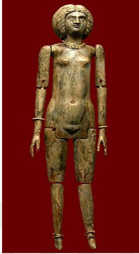
Şekil 1.10. Antik Roma dönemi İmparatoriçe Julia Domna'yı tasvir eden oyuncak bebek