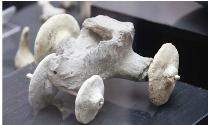
Şekil 1.4. Türkiye Mardin Kızıltepe İlçesinde bulunan oyuncak araba

Türkiye de bulunan Mardin şehrinin Kızıltepe ilçesinde bulunan bu oyuncak araba tekerlekleri de olması dolayısı ile doğrudan doğruya oyuncak özelliği göstermektedir. Bulunan bu oyuncaca bakarak dönemin gelişmişlik seviyesini de anlayabiliriz. Günümüzdeki gibi bir araba teknolojisi olmasa da sığır gibi büyük baş hayvanların çektiği arabaların yapılmış olduğunu tahmin edebiliriz. Bu oyuncacı kullanan çocuklar ise tarım toplumunun günlük hayatta kullandığı ve hayati önemi olan bu tarz araç gereçler ile erken yaşta tanışarak toplumunun gerekliliklerini içselleştirmektedir. Toplumun ciddi uğraşlarını anlayabilmek için oyuncak yolu ile bir çeşit etkileşime girilmektedir. Oyuncakların buradaki sosyal kültürel değerlere katkısı çok önemlidir.