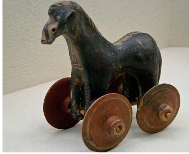
Şekil 1.3. Antik Yunan dönemi tekerlek üstünde at oyuncacı