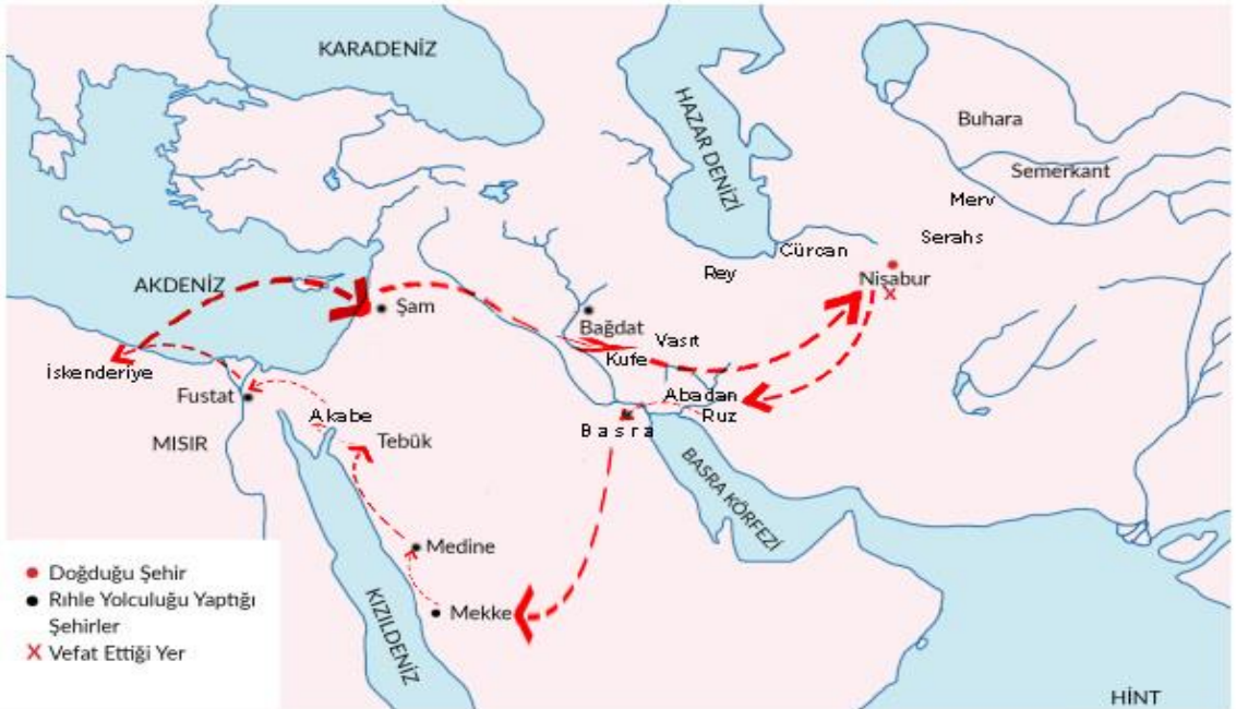
İbn Huzeyme'nin İkinci Rihlesinin Muhtemel Güzergâhı