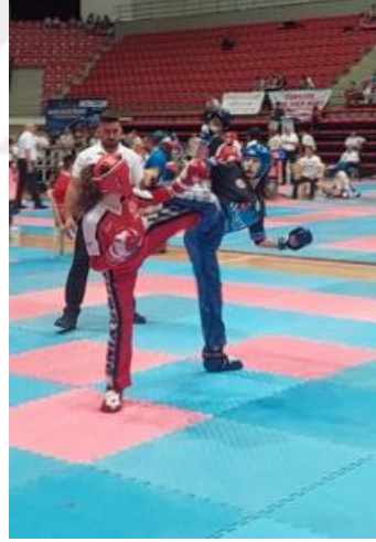
Resim 1. 2. Point fighting müsabakası

Koruyucu malzeme ve kıyafetleri branşlara ve cinsiyete göre farklılık göstermektedir. Point fighting müsabakasında kullanılan malzemeler şu şekildedir.