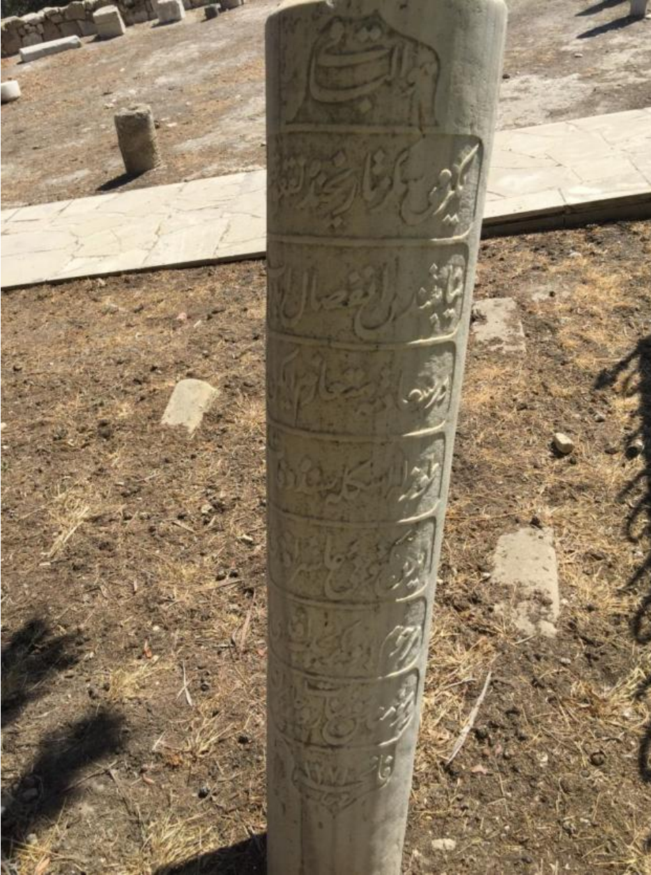
Ek.2. Ebubekir Necib Efendi'nin Mezar Kitabesi