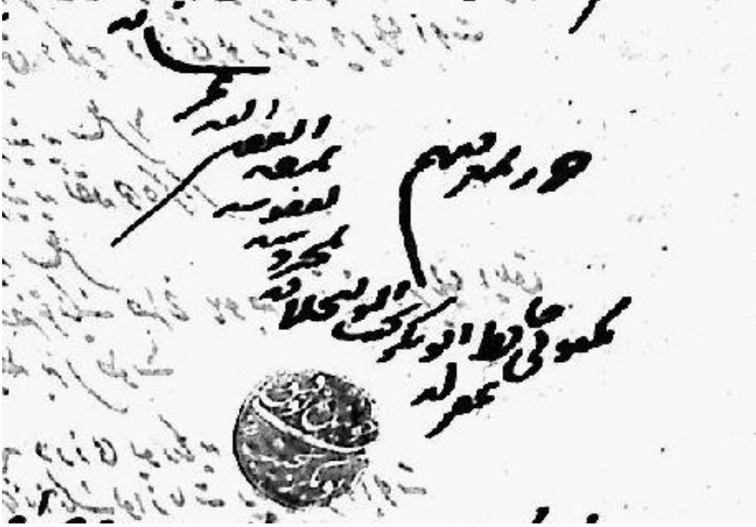
EK. 1b. Naib Ebubekir Necib Efendi'nin İmzası ve Mührü